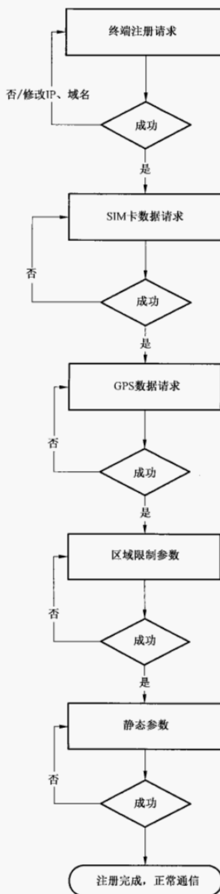
图 C.1 设备开机注册流程图