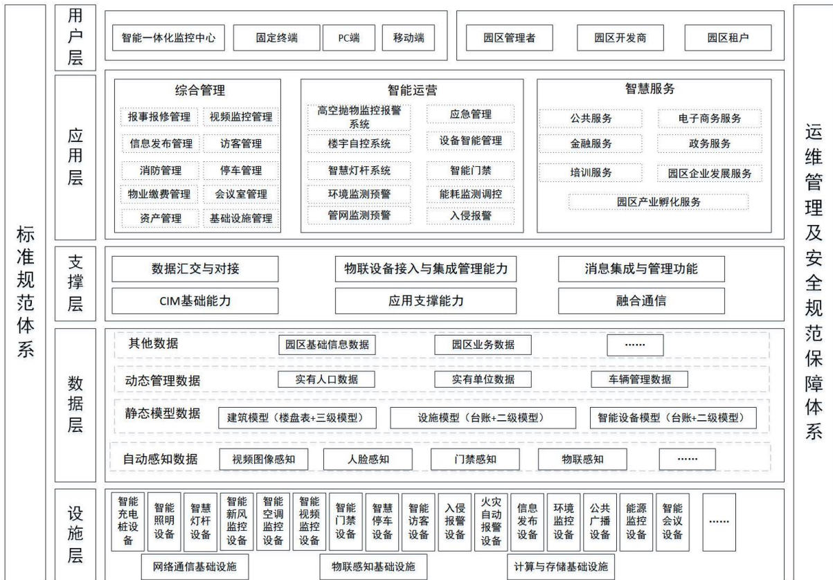
图 6.1.1 智慧园区综合信息服务系统架构图

6.1.1 智慧园区综合信息服务系统架构宜符合《信息技术云计算参考架构》GB/T 32399 和《信息技术云计算平台即服务（PaaS）参考架构》GB/T 35301 标准的规定，宜符合 PaaS 功能视图的相关规定，系统架构如图 6.1.1 所示。