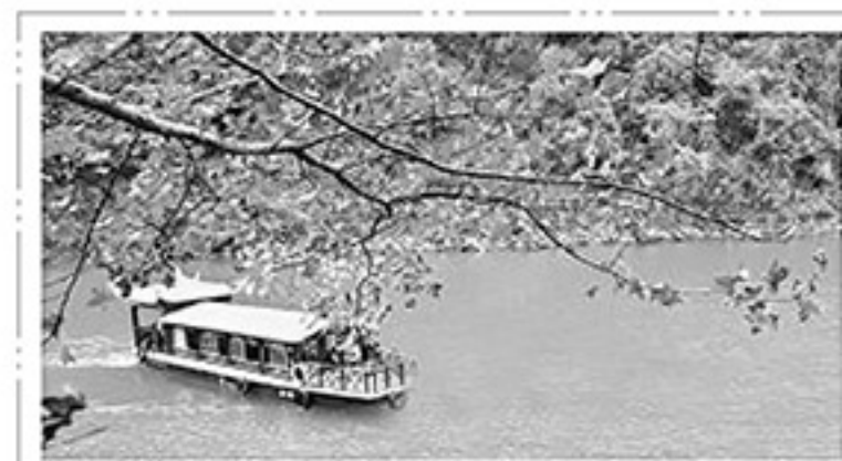
流溪河从化段环境优美，如果水质能再度提升，必将吸引更多游客。

方案分为3个阶段：近期，到2015年底，已划定地表水环境功能区的水体基本消除劣Ⅴ类水质；中期，到2020年底，完成全流域主要河涌综合整治，流域内主要地表水体水质达到环境功能区目标要求，流溪河跨行政区